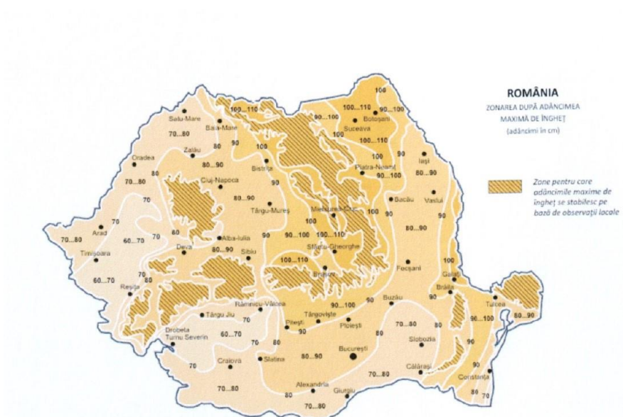
Fig. 9. Zona după adâncimea de îngheț